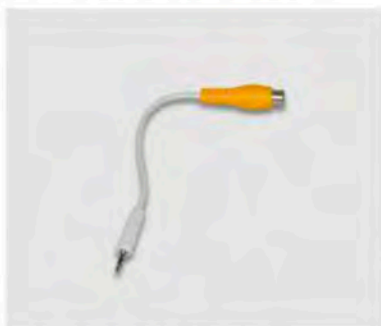
影像傳輸線 IWS (短/母線)