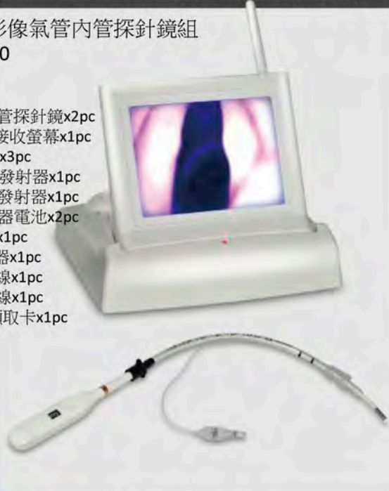
衛署醫器製壹 字第 002994 號