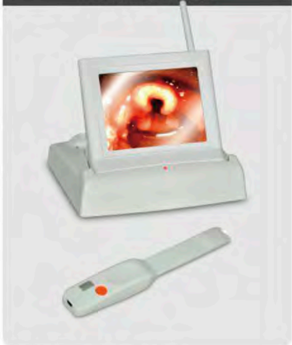
衛署醫器製壹 字第 002992 號